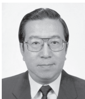
李業廣太平紳士 The Hon Charles Y K Lee, GBM, JP