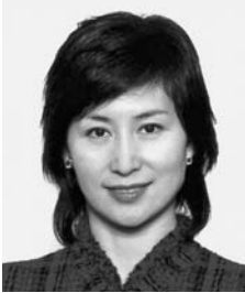
何超瓊女士 Ms Pansy Ho