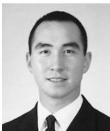
何猷龍先生 Mr Lawrence Ho