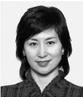
何超瓊女士 Ms Pansy Ho