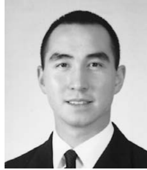
何猷龍先生 Mr Lawrence Ho