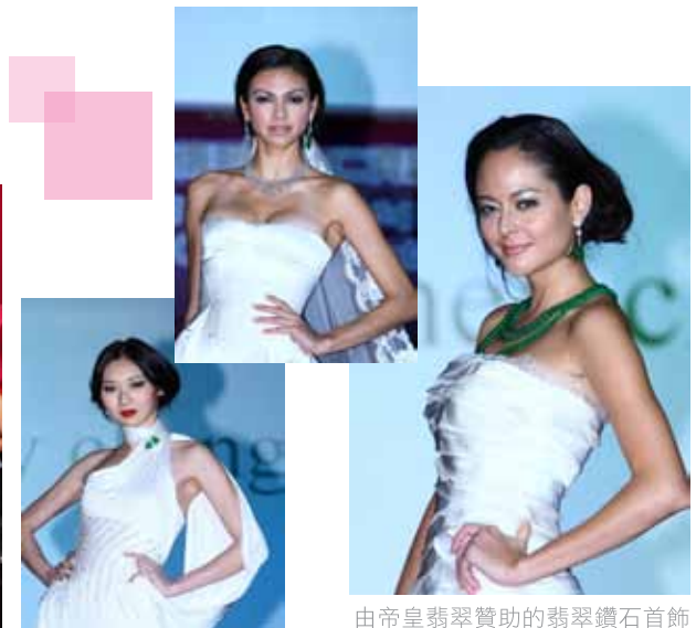
由帝皇翡翠贊助的翡翠鑽石首飾為時裝表演倍添光采

另外，大會邀得太子鐘錶珠寶捐贈18K玫瑰金鑽石錶、帝皇翡翠捐贈帝皇翡翠吊墜、Moët Hennessy Diageo捐贈Richard Hennessy #82及Mabros Jewellery Co. Ltd 捐贈男裝鑽石鱷魚皮帶作慈善拍賣，為「基金」帶來可觀善款。