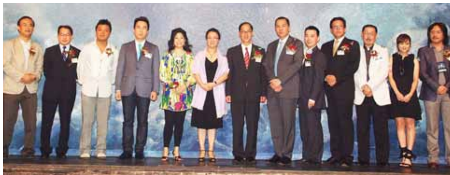
贊助人及製作單位成員一同合照留念

日期：2009年7月30日 地點：香港文化中心大劇院 主禮嘉賓：民政事務局局长曾德成太平紳士