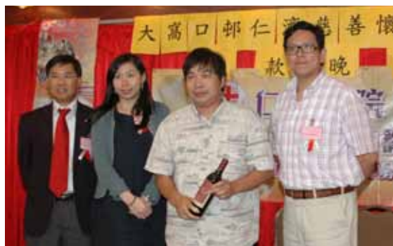
鄭承隆副主席（右一）與黃美斯總理（左二）與認投善長合照留念

「仁濟慈善雙週」由9月19日至11月30日期間舉行，活動主要包括「全港屋邨屋苑籌款」、「慈善獎券」及「慈善步行」，並為「仁濟緊急援助基金」籌募經費。活動正舉行得如火如荼，得到市民對本院的愛戴，各單位分別舉辦慈善晚宴、粵曲欣賞、上門及街頭募捐與及義賣仁濟保健湯包及各項物品。董事局成員亦積極參與由各屋邨屋苑自行籌備之慈善晚會，與眾同樂之餘亦為義工們打打氣。