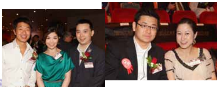
眾總理一同出席支持