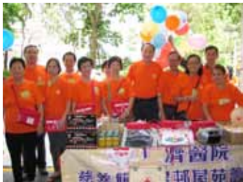
將軍澳南各界 - 尚德邨的義工於街頭向市民募捐及義賣獎券