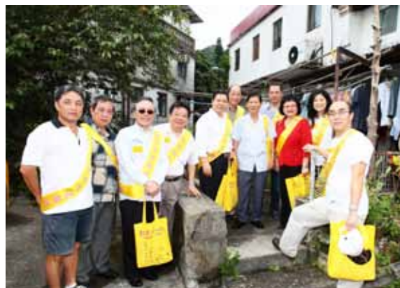
長者特意出門迎接眾嘉賓