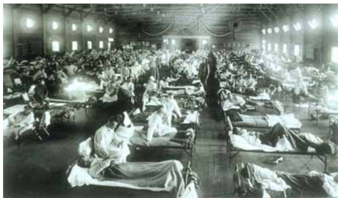
1918年美國堪薩斯州的急症病房住滿了感染流感的士兵

在這不足一百年的時間內，H1N1一詞自1918年後再次成為全球公眾焦點。本次的H1N1病毒其實是4種病毒的複雜重組產物。世界各國的科學家、醫護人員，包括中醫藥學者，正歇力阻止大流感的爆發，然而人類與流感病毒的對抗似乎是一場永不停歇的軍備競賽。