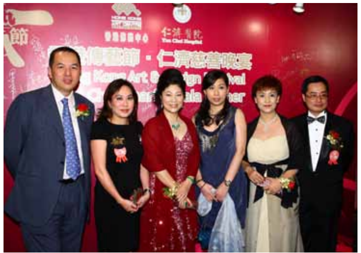
仁濟總理到場致賀

另外，大會邀得太子鐘錶珠寶捐贈18K玫瑰金鑽石錶、帝皇翡翠捐贈帝皇翡翠吊墜、Moët Hennessy Diageo捐贈Richard Hennessy #82及Mabros Jewellery Co. Ltd 捐贈男裝鑽石鱷魚皮帶作慈善拍賣，為「基金」帶來可觀善款。