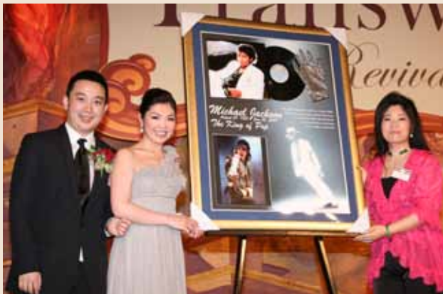
米高積遜親筆簽名相片紀念套裝獨一無二，值得收藏