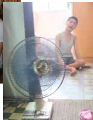
家裡使用的電風扇是二手！有否想過在今時今日，有家庭連一把全新的電風扇也買不起