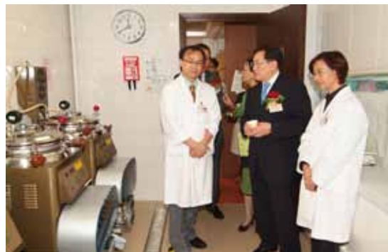
周局長參觀診所醫療設備