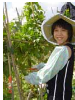
利用自然環境的學習，讓智障人士培養工作的習慣