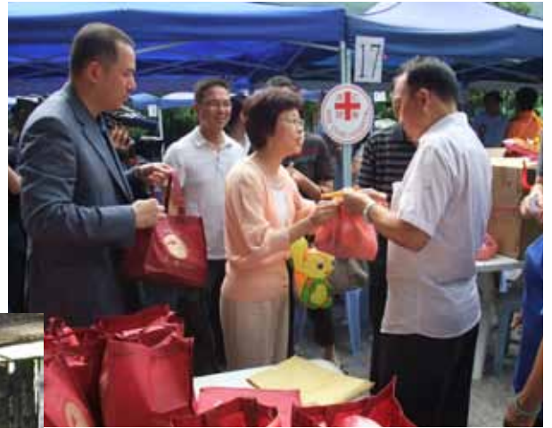
吳守基主席與陳甘美華署長除將緊急援助現金交予災民外，亦送上中秋月餅和水果

吳守基主席與民政事務總署署長陳甘美華太平紳士於火災翌日，即中秋節的下午，到火災現場慰問在村口聚集的災民。吳主席除向災民發放緊急的現金援助外，亦將月餅等應節食品送上，以表關懷。