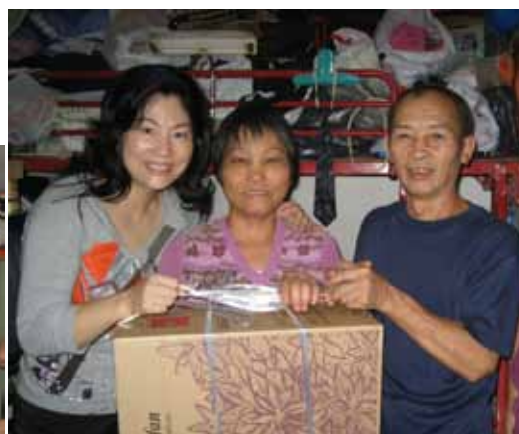
荃灣區有不少蝸居在板間房的貧苦階層，他們有些連一把電風扇也沒有