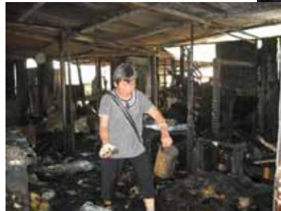
災民希望在焚毀的家園檢回未被燒毀財物