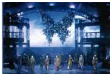
當晚演出的精彩劇照