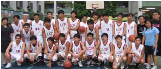
藝進同學會到校分享禁毒的訊息並與靚次伯紀念中學籃球隊進行友誼賽

宣揚禁毒的對象，除了在校內輔導學生外，我們亦為教師及家長開辦講座，教導家長識別吸食毒品後的徵狀，以了解子女是否有濫用毒品的習慣。更重要的是能夠建立良好的親子關係，加強家庭成員間的凝聚力，共同抵抗不良誘惑。