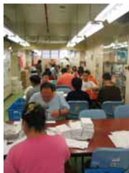
庇護工場工友執行郵寄包裝工作