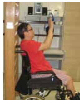
嚴重肢體傷殘人士需要進行物理治療訓練