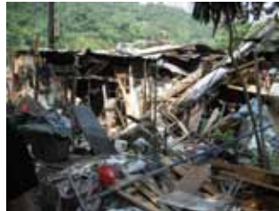
鐵皮木屋付諸一炬