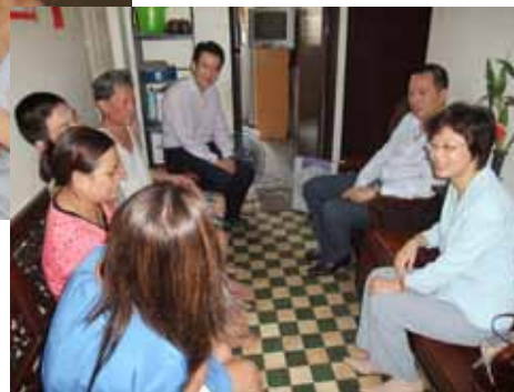
這客廳是四戶家庭共用的空間，所有住客除共用客廳外，廚房與廁所都是共用的