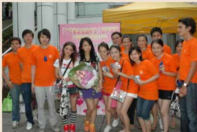
Hotcha專誠到場為大家打打氣

人氣組合Hotcha無懼炎熱的天氣，帶同大批「粉絲」，現身支持海外學生會的慈善義賣。Crystal及Regen落力向途人勸售慈善物品，錢箱內善款滿載而歸。