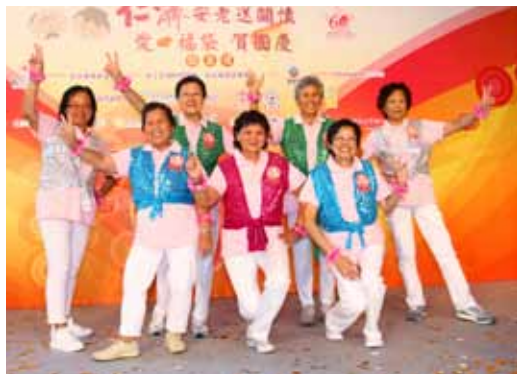
長者一同示範健體操