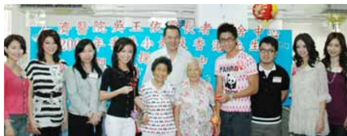
兩位老友記代表本院致送紀念品以感謝眾嘉賓蒞臨探訪

為迎接人月兩團圓的中秋佳節，董事局特別邀請應屆香港小姐冠軍劉倩婷、亞軍李姿敏、季軍熊穎詩、最上鏡小姐袁嘉敏、國際親善小姐黃嘉麗及應屆香港先生少年組冠軍陳偉洪探訪本院的吳王依雯長者鄰舍中心，向各位老友記送上由奇華餅家贊助的低糖月餅及董事局送贈的保暖背心，更與他們玩遊戲及逐一合照，眾嘉賓的熱情使中心內到處洋溢歡樂及溫馨的節日氣氛。