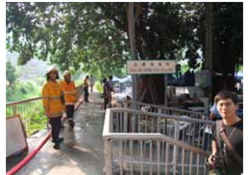
火災翌日仍有不少消防員留守現場，以防死灰復燃