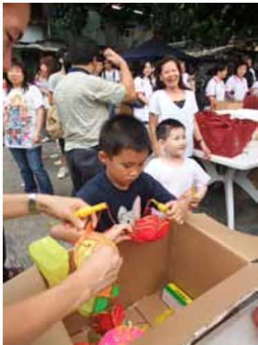
雖然小朋友有燈籠作伴，但他們卻要過一個不一樣的中秋