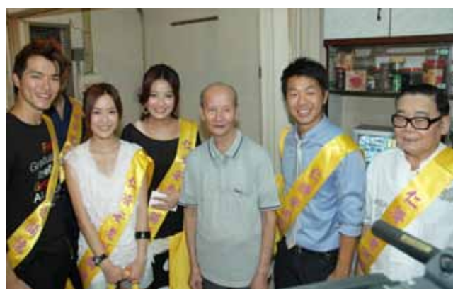
姚君達總理 (右二) 聯同藝員朋友上門送上愛心福袋予長者