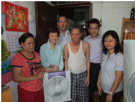
有了新的電風扇，除可抵擋酷熱天氣外，亦不必憂心使用二手電器有漏電之危險