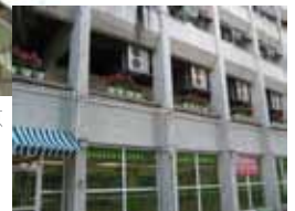
獲資助建造的花架