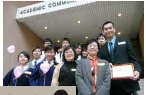
靚次伯紀念中學榮獲「卓越關愛校園」獎項