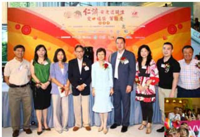
總理們與出席嘉賓合照留念