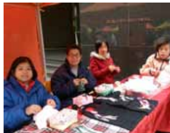
智障人士具備多方面的才能

為兒童、青少年及地區人士提供自負盈虧專業評估及治療：言語治療、職業治療、臨床心理、教育心理服務、職員及家長培訓工作坊、智障人士手工藝展示等。