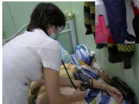
護士會定期到院舍提供健康評估，並為院舍職員提供各種護理技巧上的指導和訓練