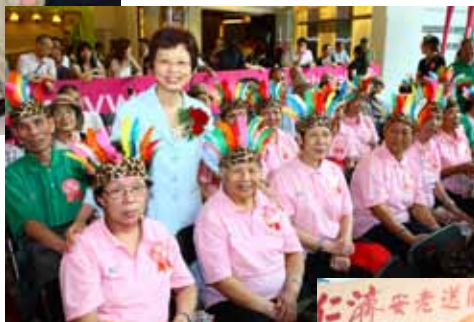
陳甘美華署長為現場表演的老友記打氣