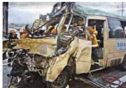
元朗公路的小巴車禍導致3人死亡，其中1位死者是單親媽媽，她有1名現年才16歲女兒。意外發生後，這位女兒頓時無父無母

與死者家屬接觸時，他們難掩傷痛之情，有的甚至搥心痛哭。雖然意外無情，但人間卻有情，自意外發生後，社會各界紛紛向死傷者家屬提供支援，而「仁濟緊急援助基金」亦向上述意外的死者家屬給予經濟幫助。