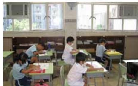
安裝了環保冷氣機及隔熱膜的課室更顯清涼