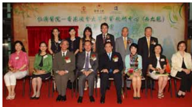
開幕典禮上各嘉賓合照留念

該中心由仁濟醫院、醫院管理局及香港浸會大學合辦，面積約三千平方呎，內設有8間診症室、1間治療室、評估室及中藥房。中心設有醫管局所發展的中醫醫療資訊及中藥藥劑管理系統，又將中醫病歷、處方及配藥服務電子化及標準化，由登記至開藥方均全以電腦紀錄，中心職員只需讀取覆診咭的條碼，便可取得所需資料，方便快捷、省時準確。