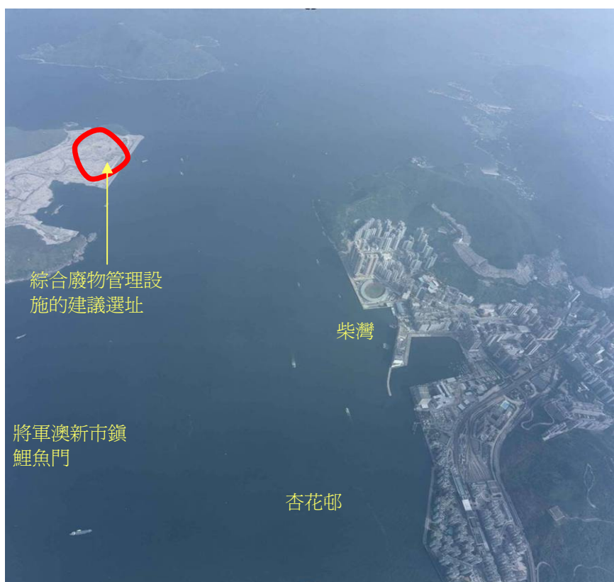
圖 2 – 將軍澳第 137 區的鳥瞰圖