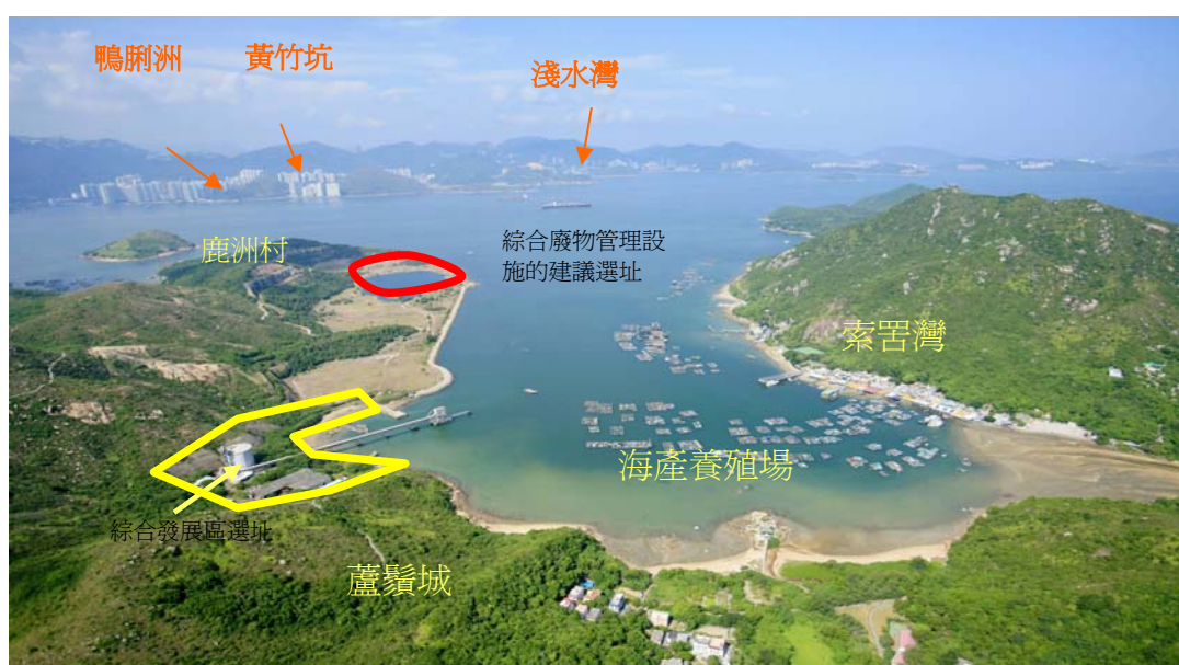
圖 3 – 南丫島石礦場舊址的鳥瞰圖