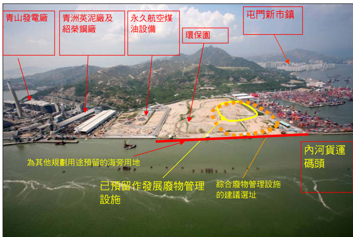
圖 5 – 屯門第 38 區的鳥瞰圖