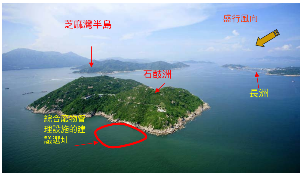
圖 6 – 石鼓洲的鳥瞰圖