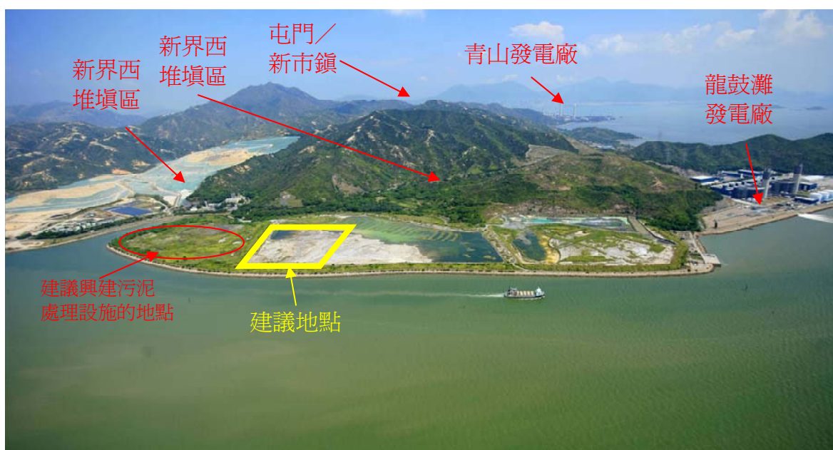
圖 7 – 曾咀煤灰湖的鳥瞰圖