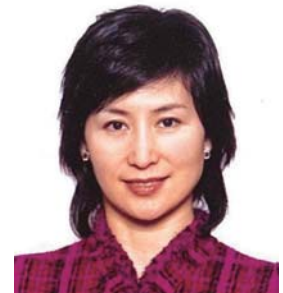
何超瓊女士 Ms Pansy Ho