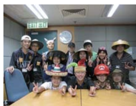
政府部門組別 Civil Service Category