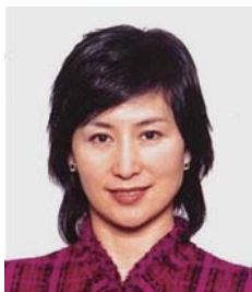
何超瓊女士 Ms Pansy Ho