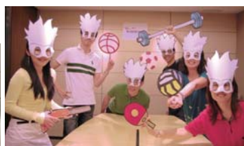
機構及團體組別 Companies & Organisations Category