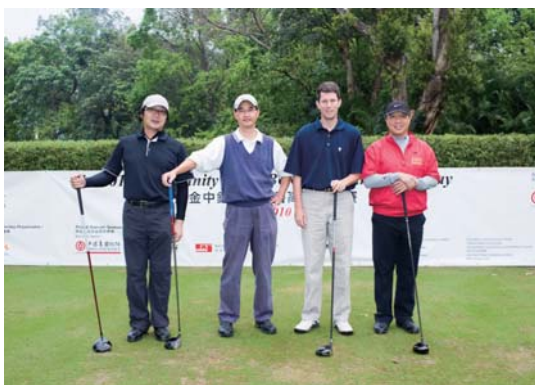
「全場總冠軍」及「最佳球分獎」得獎隊伍 Baker & McKenzie "Champion" and "Best Gross Award" winner – Baker & McKenzie

South Asia Textiles (Holding) Limited Sunnyside Limited Tang Wing Cheung and Sons Company Limited Tsang Chik Kwai Tong Charity Foundation Fund Limited Vimchamp Garments Limited Wang On Group Limited Westminster Travel Limited