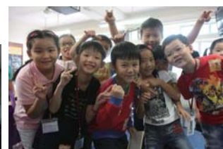
教育機構組別 Educational Institutions Category