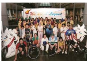
機構及團體組別 Companies & Organisations Category