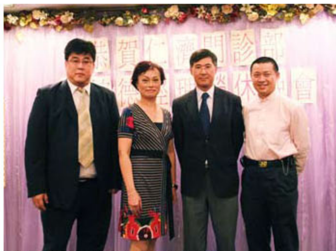
仁濟醫院與董事局同事於6月18日歡送吳姑娘

2003年沙士襲擊，醫院各部門要守緊自己崗位抵禦，吳姑娘的門診部亦是一個極前線的部門，隨時有隱形病人、病毒入侵，要在每日緊張的疫情下，為門診、長期病患者安排診症、覆診、打針、抽血、洗傷口、拆線……又要確保部門內幾十位前線員工免被沙士擊敗，要有很高的領導能力，吳姑娘帶領下的一整個門診部任何時間都發揮着團結而高效率的工作態度；仁濟醫院亦一樣，沙士一疫，近乎零感染的戰績，讓每位員工莫不鬆一口氣。