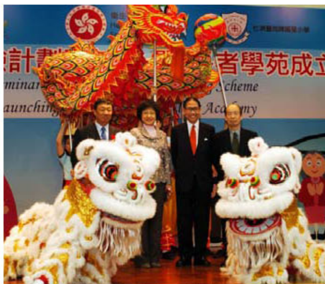
第一間「長者學苑」於仁濟醫院陳耀星小學成立

梁醫生亦非常有遠見，他舉例如10年後，長者的知識水平及要求會不斷提高，現有課程未必能滿足他們需要；加上不少長者反映他們有「上大學讀書」的期望，所以進一步將「長者學苑」的模式推展至大專院校，現時已有7間大專院校參與「長者學苑」計劃。梁醫生欣喜的說：「長者會讀發大學學生證及圖書證，更可