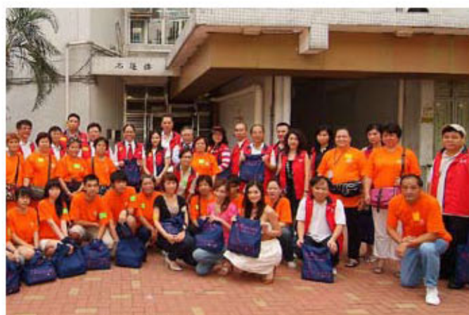
眾嘉賓及義工在探訪前先来一張大合照留念