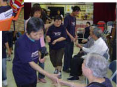
社區共融活動：與長者共渡歡樂時光