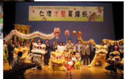
龍獅點睛嘉賓合照