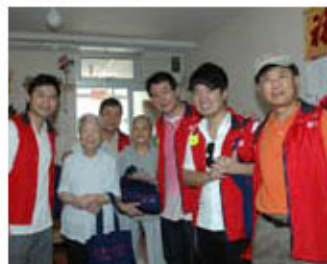
眾出席嘉賓與受訪長者合照留念