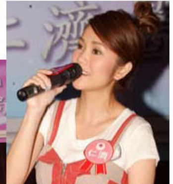
表演嘉賓謝安琪及Hotcha落力演出