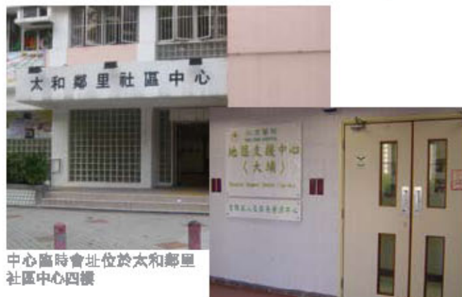
中心臨時會址位於太和鄰里社區中心四樓