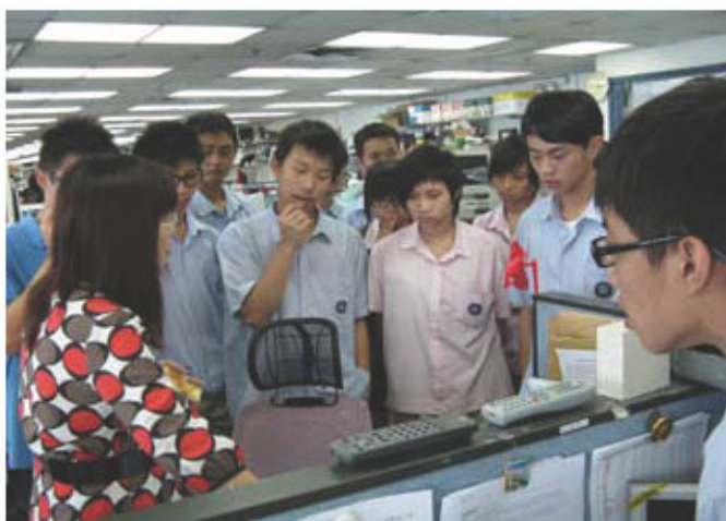
為配合新學制，老師帶領綜合人文文科同學參觀經濟日報編譯部

同學都滿意學校在初中時給予各學科的英語增潤課程，讓他們有信心在高中時轉用英語學習數學、物理、化學、生物、地理、世界歷史和資訊及通訊科技等科目。對其他學習經歷安排方面，他們對學校甚有信心，特別是學校在提供予同學參加社會服務方面，同學們都可親身體驗其中，大家都十分喜歡當義工的經驗。「大家對新高中學制十分雀躍和期待，相信羅中的同學可以享受到學校為他們帶來的學習樂趣。」黃副校長總結時說。