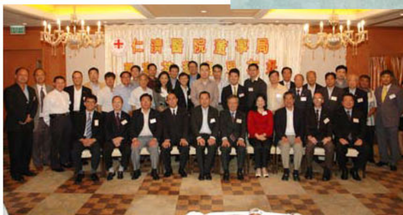
臺灣各界友好—臺灣鄉事委員會、臺灣商會及國玄學院