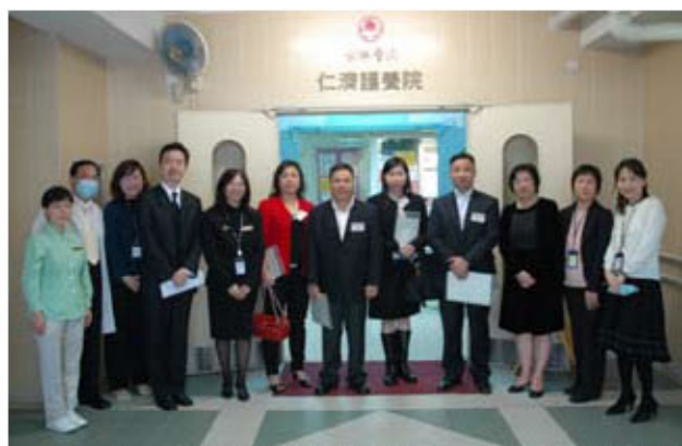
部門主管陪同新總理參觀位於綜合服務大樓的仁濟醫院

原來他們除了在金錢上支持仁濟的慈善工作外，更加關心本院的服務和發展。新一屆董事局伊始，各位新總理於繁忙中都抽空出席總理迎新日，除細聽各部門介紹本院服務外，更隨單位主管進行實地探訪，藉以了解各項運作。