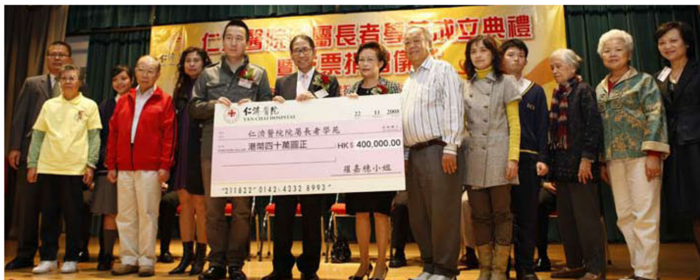
仁濟其中4間「長者學苑」一同舉行成立典禮暨支票捐贈儀式

與大學生一同上堂，甚至於暑假期間安排入住學生宿舍，真實感受大學的校園生活。對於大部份的長者來說，入大學讀書是一個遙不可及的夢想，但終可實現！」