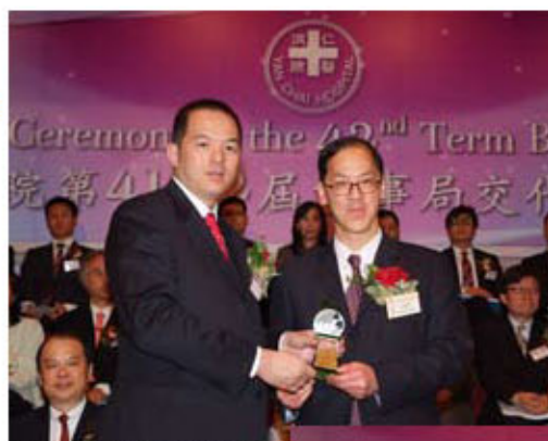
新一屆董事局吳守基主席感謝曾德成局長為新一屆總理監督就職