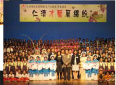
藝員及嘉賓與閉幕匯演 眾學生大合照