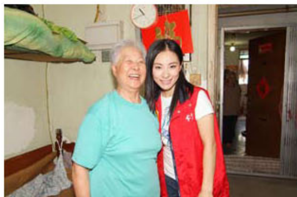
前國家金牌運動員劉敏儀小姐蒞臨探訪，令婆婆笑逐顏開