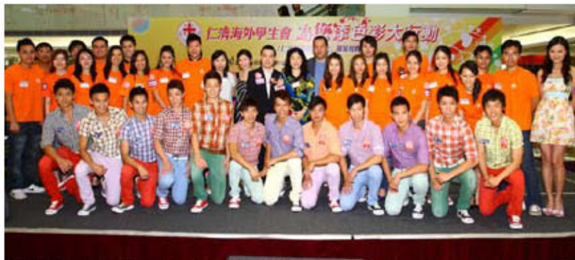
董事局成員、海外學生會成員及12位香港先生候選人合照