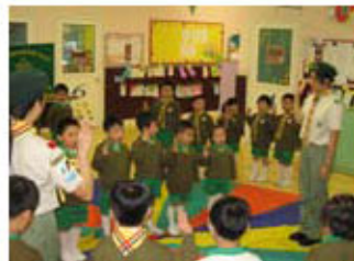
宣誓後，大家就正式加入1197旅

此外，據荃灣第24旅旅長顏瓊璋先生表示，能夠獲香港童軍總會評為「優異旅團」的單位必須經嚴格評審，在多方面顯示出優秀成就，方可獲頒殊榮。一個旅團的成功，除了需要完善管理、持續訓練和良好的團隊合作精神之外，更需要主辦單位的鼎力支持，仁濟醫院董事局便肩負起這項重任，令旅團得以持續地發展。顏旅長希望仁濟各院屬旅團的成就可以更上一層樓，大力發展童軍運動。