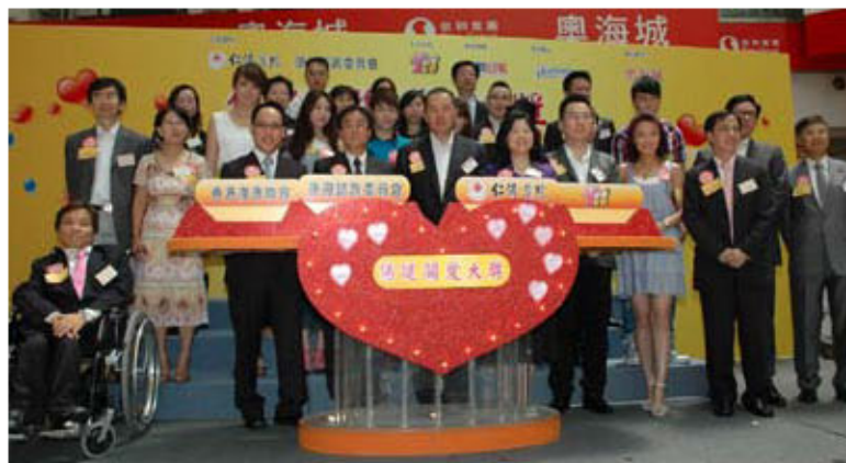
康復諮詢委員會及仁濟醫院董事局成員、評審委員會委員及嘉賓均響應出席記者會，呼籲市民提名傑出義工及照顧者參選

上述活動由仁濟醫院與勞工及福利局屬下康復諮詢委員會聯合主辦，TVB「香港力量」全力支持，勞工及福利局局長張建宗GBS太平紳士出任榮譽贊助人，目的為表揚一群服務殘疾人士的傑出義工及悉心照顧殘疾親屬的照顧者，藉此向社會傳達正面及關愛的訊息。