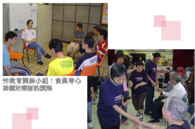
性教育調解小組：會員專心聆聽治療師的講解