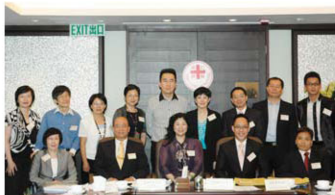
專業的「評審委員會」委員於評審後來張大合照

得蒙各界鼎力支持，參加者眾，而各候選人背後的故事皆十分勵志感人，由仁濟醫院與康復諮詢委員會成員及復康界代表組成的「評審委員會」好不容易從最後入圍名單中，成功選出 5 名傑出義工及 5 名照顧者。