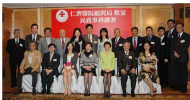
各顧問局成員與多位官員合照留念

顧問局唐尤淑祈主席帶領各成員與民政事務總署署長陳甘美華太平紳士會面，並於席上探討仁濟醫院各項服務及醫院重建計劃的發展，以配合地區民生的需要。