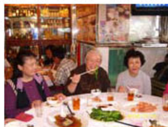
家長支援小組：家長參與聚會及分享生活經驗

本院的地區支援中心(大埔)將承傳一貫優質服務的精神，為大埔區殘疾人士及其家人提供多元化及一站式的社區支援服務，使他們在社區中享有及享受具質素的生活，並期望他們能與社區和諧共處。