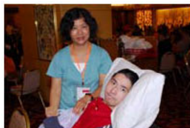
胡女士悉心照顧愛子起居飲食