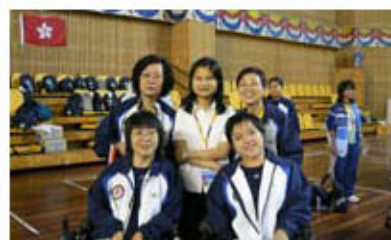
梁女士參與香港硬地滾球代表隊，出駐北京殘疾人奧運會