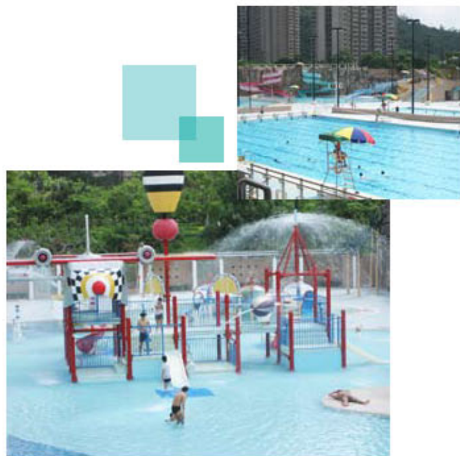
發生10歲童遇溺喪生的嬉水池

死者已矣，除希望上述兩位逝者安息外，亦盼家屬們能儘早抹去哀傷，並祈普長支持「仁濟緊急援助基金」的援助工作，俾使繼續為有需要的人士提供幫助。