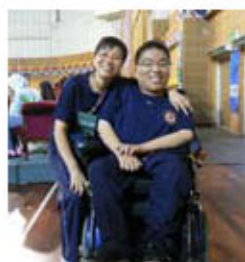
梁女士與傷健運動員感情要好，仿如一家人

由多年前開始，她便參與香港硬地滾球代表隊，協助大腦痲痺和肌肉萎縮病的運動員代表香港出赴國際比賽。梁女士不諱言從他們身上亦學會許多，她說：「每當我遇上不愉快的事情，我便會以他們永不放棄、堅毅精神來激勵自己」。此外，梁女士亦致力推廣硬地滾球運動，經常走訪各特殊學校，教授老師及學生有關硬地滾球知識，培訓具潛質的新力軍。去年，她更協助香港代表隊參加北京殘疾人奧運會，為香港勇奪一金一銀的彪炳佳績。