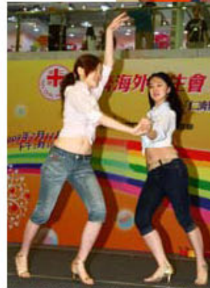
多才多藝之海外學生，以精彩表演，帶動現場氣氛