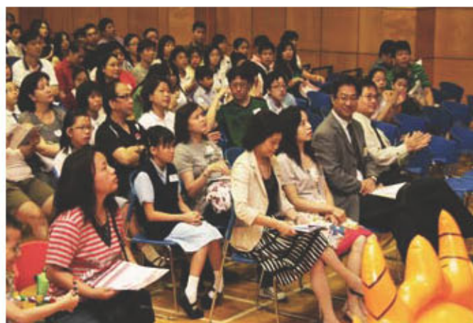
新高中學制家長諮詢會