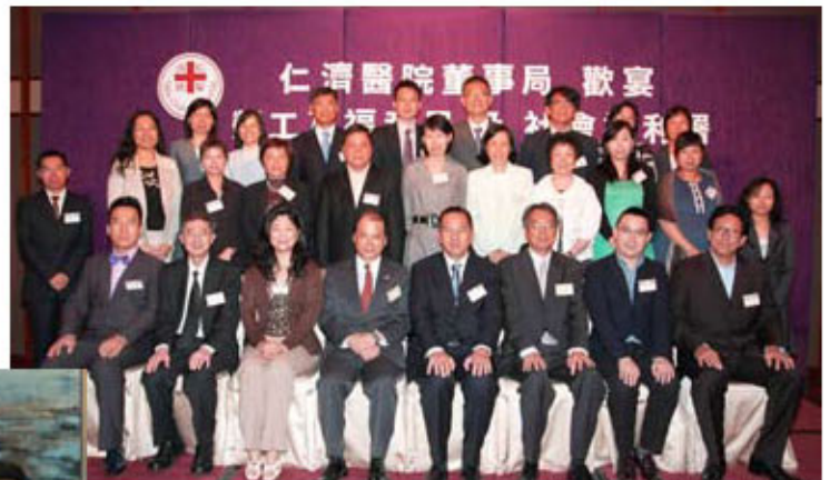
勞工及福利局及社會福利署