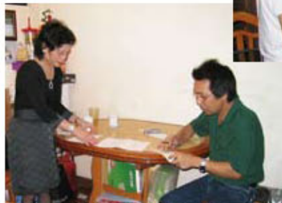
區校長將校方籌得的捐款悉數轉交予劉先生