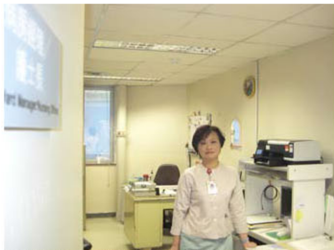
這個辦公室由1983年開始便一直與吳姑娘共同工作了26年