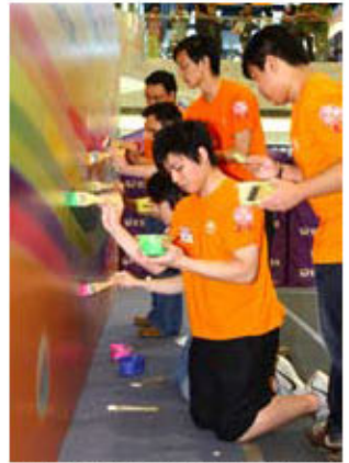
學生正合力繪畫彩虹，喻能為社會上有需要人士的生命添上一點色彩