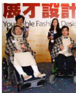
患病的身體身體日漸穩定，與其他義工感情融洽