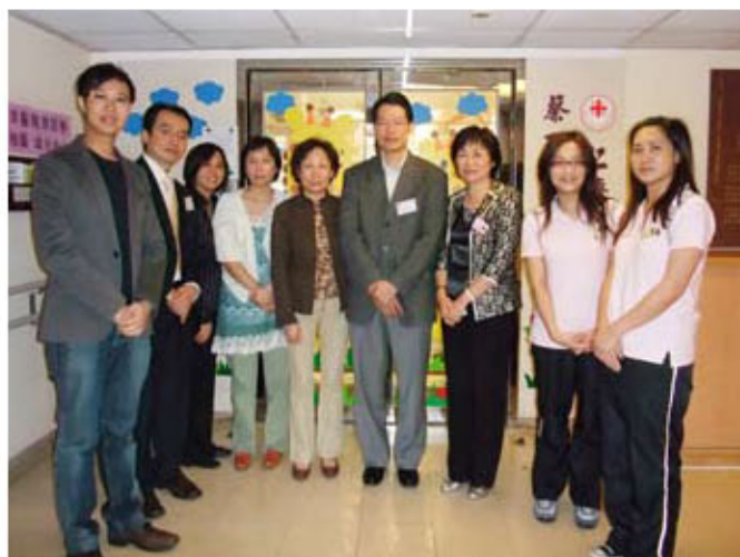
仁濟醫院「兒童及青少年科社區健康推廣組」於5月曾到葵百泰幼稚園/幼兒中心提供教育講座，希望透過與學界合作，促進區內兒童及青少年健康