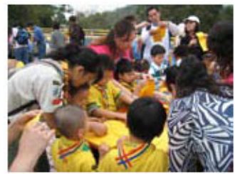
「小童軍航天同樂日」，一齊學唱 歌機噠！