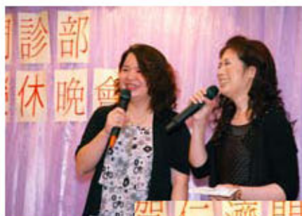
同事依依不捨之餘，亦喜見吳姑娘開展退休後優悠閒適的生活

我們在此衷心感激吳姑娘36年為仁濟醫院作出的貢獻，更曾吳姑娘開展人生另一階段而感到高興。