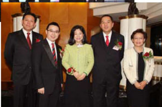
嘉賓友好歡樂，與董事局成員相聚聯歡