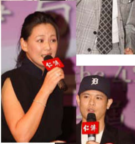
一眾到場的歌手均全程投入，即興獻唱