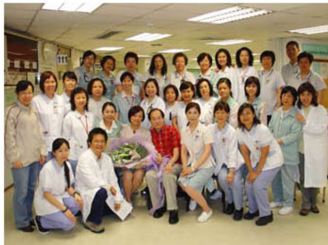
吳姑娘最捨不得的是一班在門診部工作的同事。6月16日吳姑娘工作的最後一天，一班同事正式把吳姑娘交回到她丈夫身邊（吳姑娘右側紅衫者），從此夫妻倆可隨時遨遊天下了。