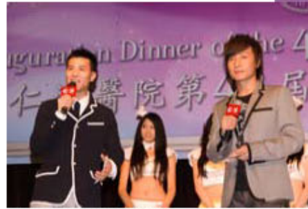
遊戲環節令全場笑聲滿載