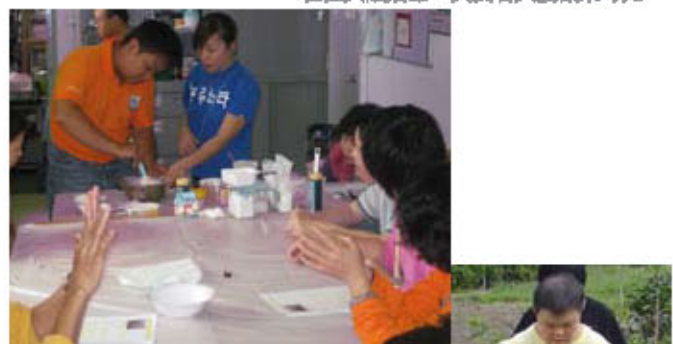
興趣小組：會員投入製作小食