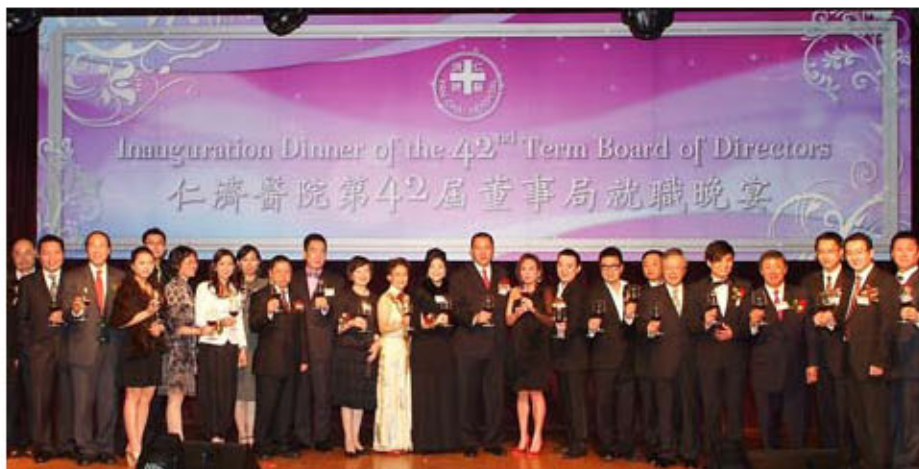
全體總理、顧問及名譽理事向嘉賓祝酒致謝