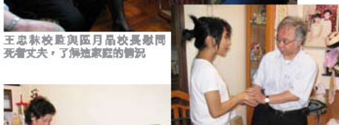
家逢巨變，長女可能要為照顧年幼弟妹而不能繼續在台灣的學業，王忠祿校長聞悉後非常關心