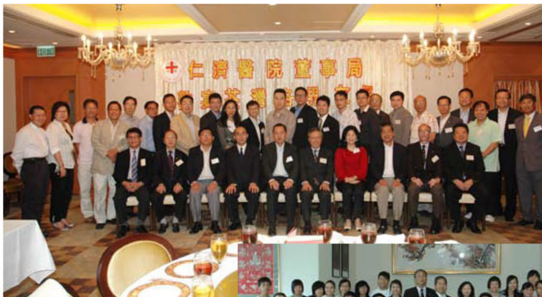
臺灣各界友好—臺灣民政事務處及臺灣區議會