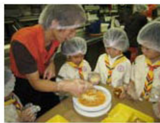
聚餐分享一年的感受