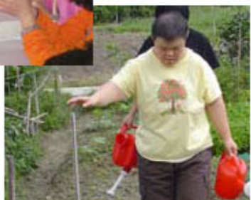
有機耕種活動：會員忙於澆溉

社會福利署有見殘疾人士及其照顧者對社區支援服務需求殷切，為了提升他們在社區生活的質素，並讓他們能順利獲取所需資源，由2009年1月1日起，撥款資助15間機構，將家居訓練及支援服務重整為16間地區支援中心。